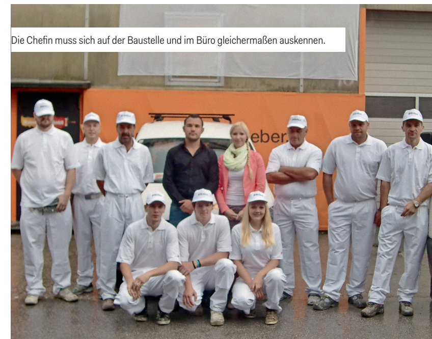
Die Chefin muss sich auf der Baustelle und im Büro gleichermaßen auskennen.

Als Malerin kann ich Kreativität zeigen und neue Kontakte knüpfen. Der Umgang mit den unterschiedlichsten Menschen und die täglich neuen Aufgabenstellungen sind besonders interessant. Malerin zu sein ist keine monotone, sondern eine sehr abwechslungsreiche Arbeit.